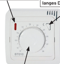
Bedienungselemente - Einstellrad zur Einstellung der Temperatur